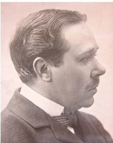
هالمار سویدیربرگ (Hjalmar Söderberg)