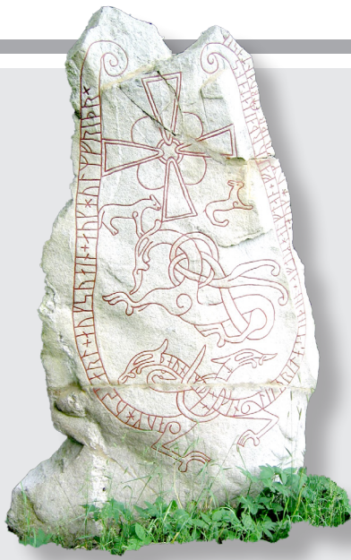
كەفرىن رۇنى (Rune Stones)

ئەدەبىياتا سویدی ھەقىقىي ئەدەبىياتا گەلەك وولاتىن ئەورۇپى ژ دەقن داستانى و مەزھەبى دەست ب گەشەكرنى و پىشقەچوونى كرى يە و د قۇناغىن جودا دا ل بن كارىگەرى يا بزاڧا ئەدەبىياتىن ھەك رىنىسانس، رۆشەنگەرى و پۇمانسىزمى دا بوويە. د فى بابەتى دا ب رەنگەكى كور دى ل سەر قۇناغىن نقىسەرىن كلاسىكىن سویدی پراوستىن: