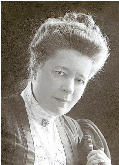
سەلما لاگروف (Selma Lagerlöf)

(Strindberg och Lagerlöf) هەنە و هەتا ئەفرۆ ژى نقىسەر و هونەرەند ئیلهامى ژى وەرەگرن.