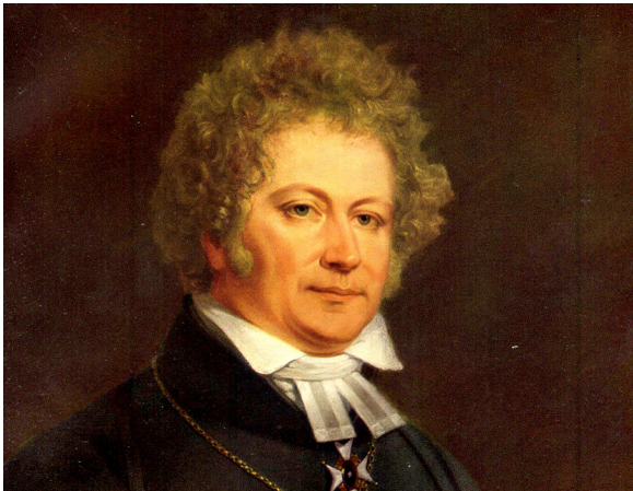
ئىسایاس تىگنېر (Esaias Tegnér)

۳-چەرخى ۱۸ئى سەردەمى پۆشەنگەرى و ئەدەبىياتا ناسیونالیستى.