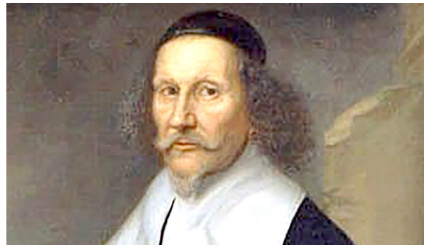
جۆرج ستىرنھىلم (Georg Stiernhielm)

خوہ دا ژيانا خەلكن نۆرمال و ھەژار و ھەلكەفت و مۆزىكا جاددەيىن ستوكھۆلمى وىنە دكرن و ھەتا نوکە ژى ب ئىك ژ كەسايەتییىن ديارىن ئەدەبىياتا سویدی د ھىتە ناقرن.