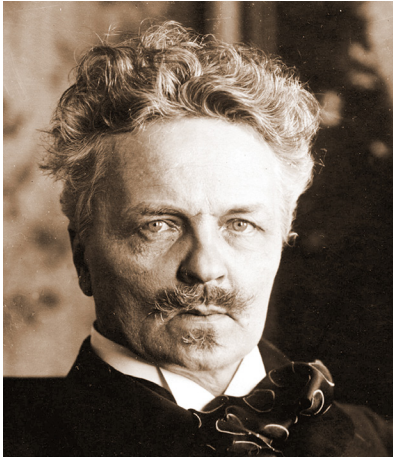
ئاگوست ستړىنبرگ (August Strindberg)

وەرگرتى يە و کاریگەریه کا مەزن ل سەر ئەدەبیاتا سویدی یا هەبوویه.